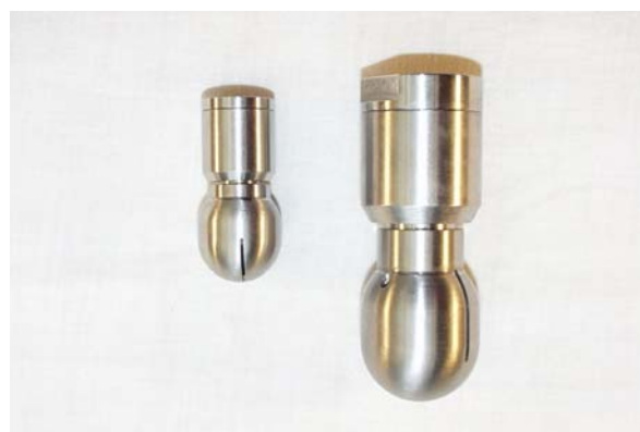
MICRO SPINNER 5200C