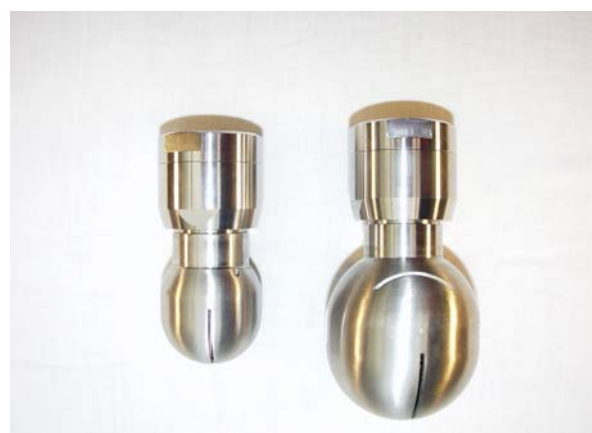
MAXI SPINNER 5500