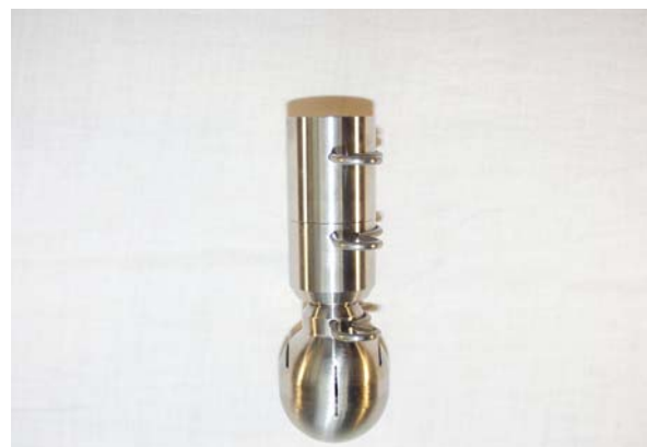
MINI SPINNER 5100SA